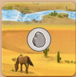
Ein produzierendes Gelände (Stein)

Die Effekte der Geländeplättchen werden später noch genauer erläutert. Zunächst ist nur wichtig, dass einige Gelände Rohstoffe produzieren (Rohstoff im Kreis), andere erlauben, Rohstoffe zu lagern (Lagersymbol) und manche beides tun. Wiesen haben besondere Effekte, die ebenfalls später erläutert werden.