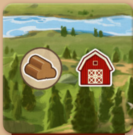
Ein produzierendes Gelände, auf dem man auch lagern kann