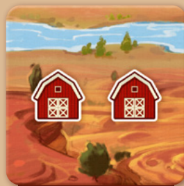
Ein Gelände, auf dem man lagern kann