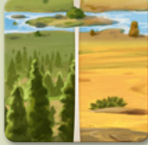
4 gemischte Gelände